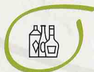
ENVASES DE VIDRIO